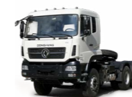
KC 6x4 380 ADR OPTIONNEL