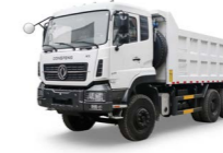
KC 8x4 375