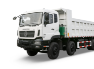
KC 8x4 420