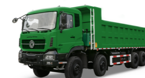
KC 8x4 375