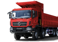
KC 8x4 420 MINIER