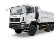
KC 6x4 375