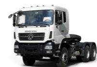
KC 6x4 380 ADR OPTIONNEL

Toutes les photos de ce document sont non contractuelles