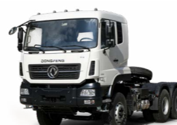
KC 6x4 420 ADR OPTIONNEL