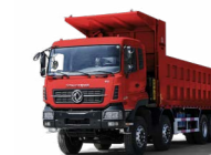
KC 8x4 420 MINIER