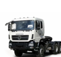
KC 6x4 380 ADR OPTIONNEL