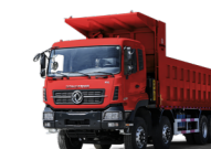
KC 8x4 420 MINIER