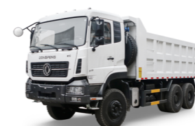
KC 6x4 375